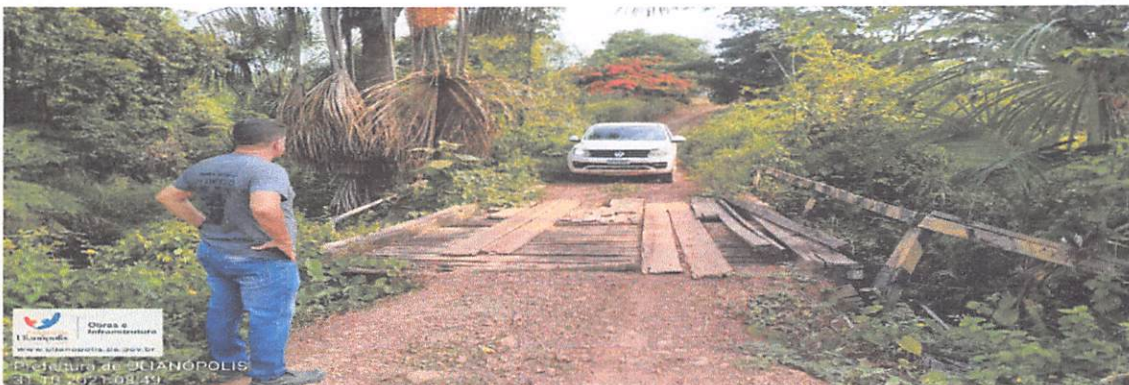
PONTE 12 X 5 METROS, RAMAL DO SEU DADÁ, REGIÃO DA VILA UNIÃO, PONTE QUEBRADA. PRECISA SER SUBSTITUÍDA. INTERDITADA.