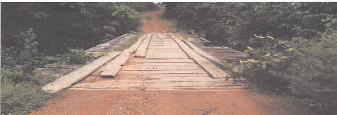
PONTE DE 19X5 M RAMAL DA MARANHENSE, ESTRURA EXISTENTE ESTÁ COMPROMETIDA. COM RISCO DE DESABAMENTO, FALTA GUARDA CORPO

Legislação Municipal de Ulianópolis Comissão de Licitação Contato Telefone