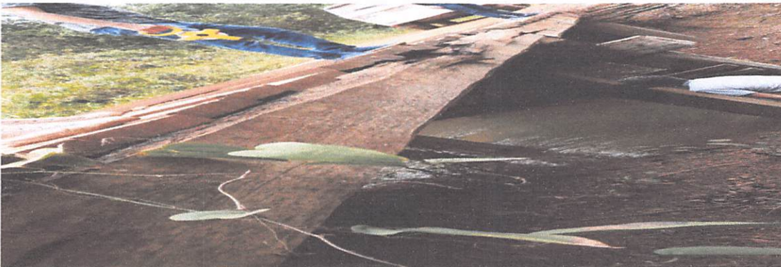
PONTE DE 13 X 4 M ÁGUA BRANCA SENTIDO RIO DO OURO PROBLEMA NAS ESTRUTURA DE SUSTENTANÇA.