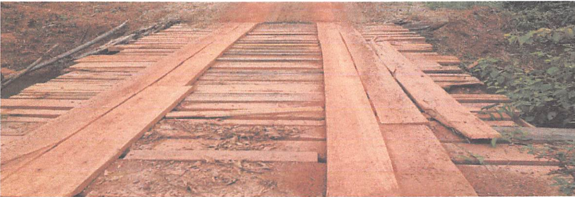
PONTE DE 9 X 5 M, APÓS A ÁGUA BRANCA COM VARIOS PROBLEMAS NA PARTE SUPERIOR, FALTA GUARDA CORPO, QUADRADOS LONGARINAS ESTÃO QUEBRADOS