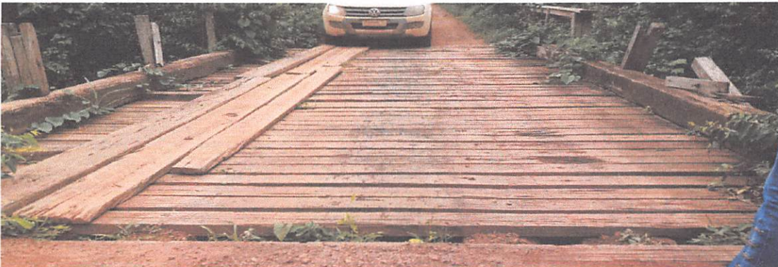
PONTE DE 11 X 5 M DA VICINAL DA SÃO JORGE PARA BOM JESUS, QUARADOS ESTÃO QUEBRADOS RODA GUIA DANIFICADO.