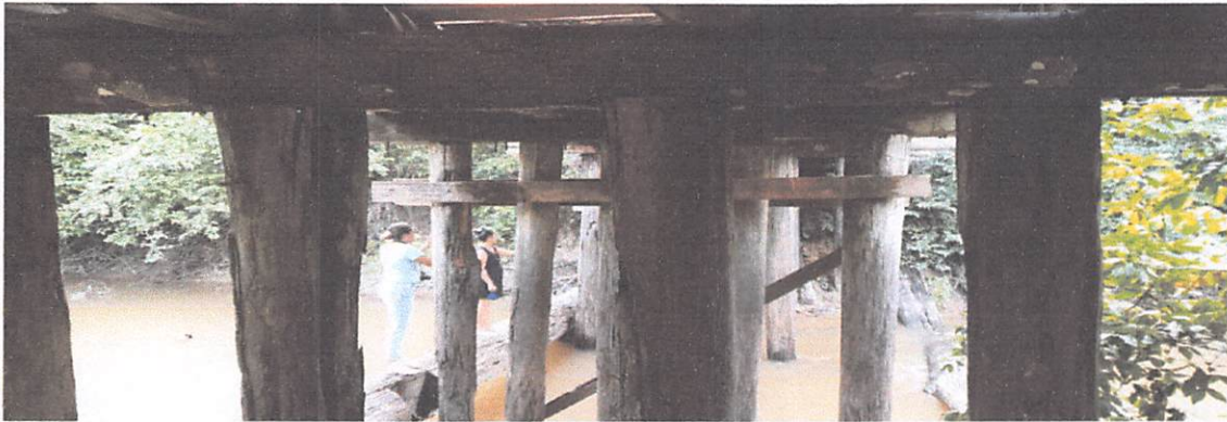
PONTE DO 100 ALQUEIRES DE 25 x 5,0 M ESTRURAS COMPROMETIDAS. PILARES, VIGAS E CABECEIRAS APRESENTAM DIVERSOS TIPOS DE PROBLEMAS ESTRURAL