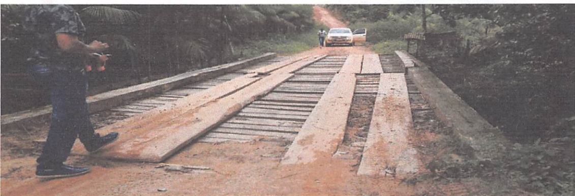
PONTE DE 16 X 5 M DA VICINAL DA BOM JESUS QUADRADOS ESTÃO QUEBRADOS RODA GUIA DANIFICADO.