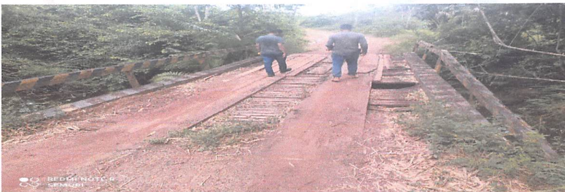
PONTE 17 X 5 METROS, PROXIMO SÍTIO JERUSALEM, RAMAL DEPOIS DA AREIA BRANCA, MADEIRAMENTO DETERIORADO.