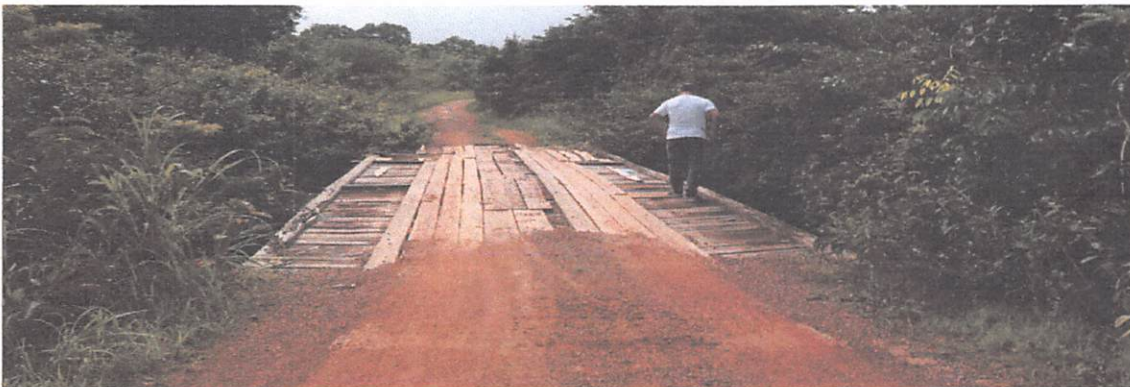
PONTE DE 16 X 5,0 M DIVISA COM RIO BONITO, ESTRURURA SUPERIOR ESTÁ COMPROMETIDA, SEM GUARDA CORPO, RODA GUIA, QAUDRADOS DANIFICADOS