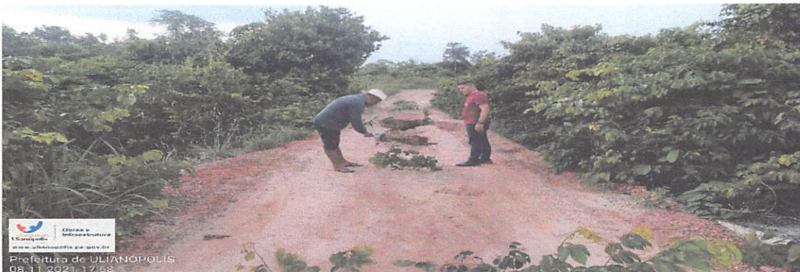
PONTILHÃO DE 20 X 5 METROS, RAMAL DO NEGO, PROXIMO A VILA DO KM 14, MADEIRA PRECISA SER SUBSTITUIDA.