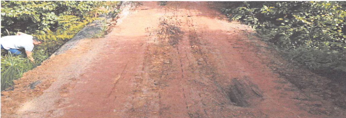
PONTILHÃO DE 12 X 4 M RAMAL DA BOA ESPERANÇA ATERRO COM EROSIÃO PILARES DE SUTENTANÇA DANIFICADOS.