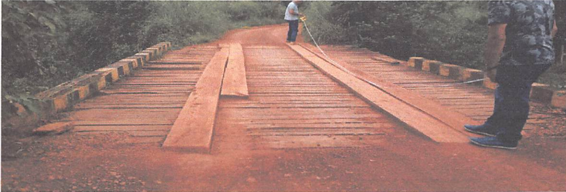
PONTE DE 11 X 5 M DA SAPUCAIA COM VARIOS PROBLEMAS NA PARTE SUPERIOR, FALTA GUARDA CORPO, QUADRADOS E LONGARINAS ESTÃO QUEBRADOS.